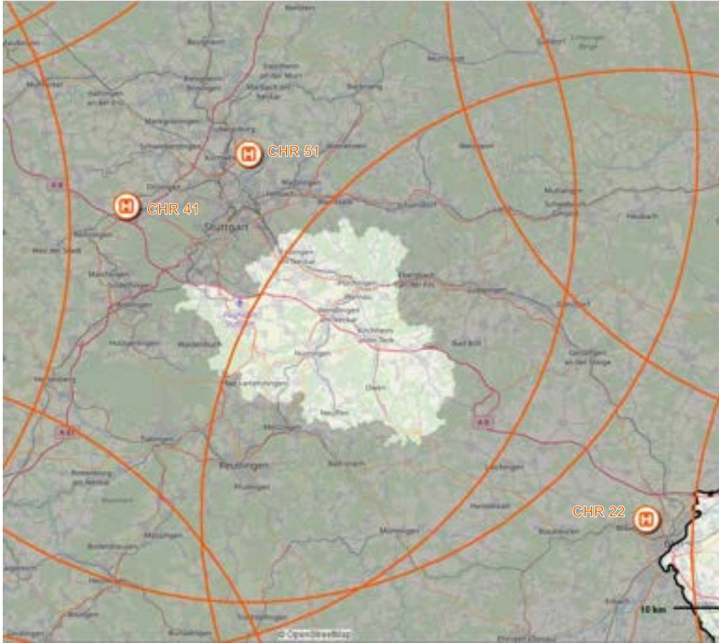
Abbildung 3: Luftrettungsstationen und Flugradien