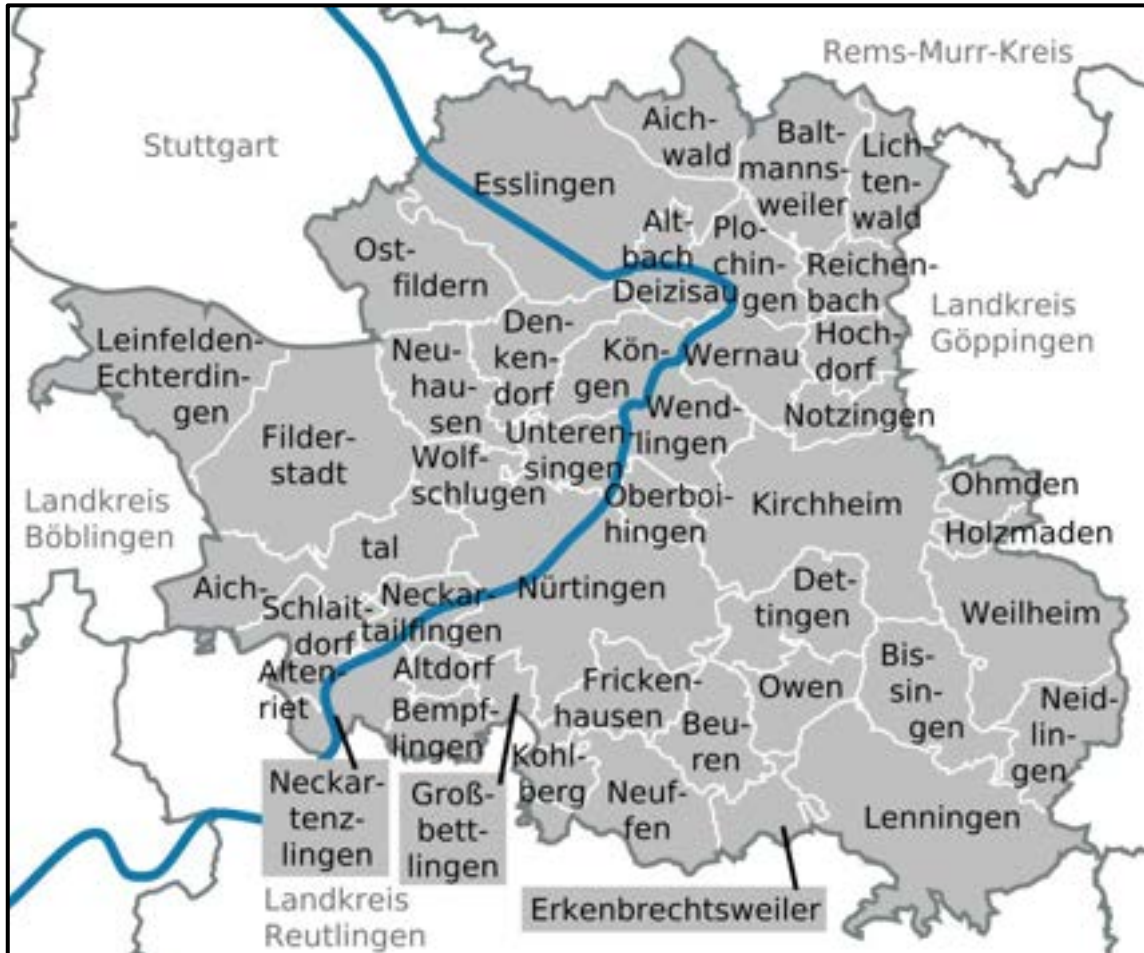
Abbildung 1: Gemeinden im RDB